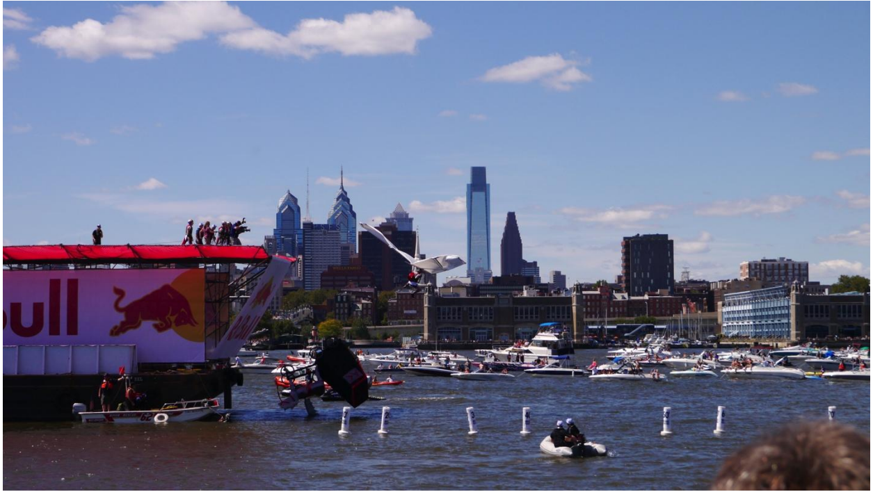
在紐澤西舉辦的鳥人大賽，背景是費城市區