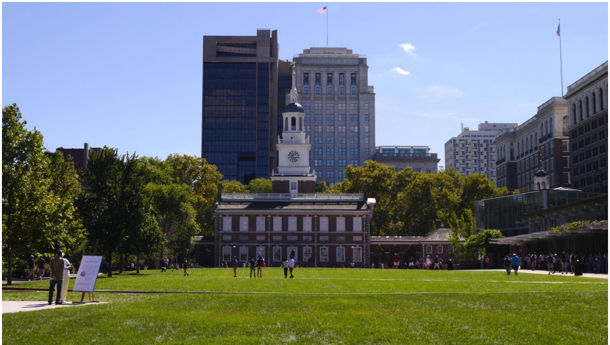
美國憲法與獨立的發源地，費城自由鐘與舊市政廳！這是所有美國人都要來朝聖的地方！