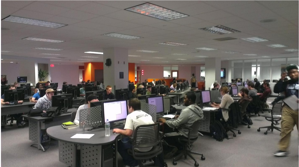
學校的 Tech Center 有數百台 Windows 以及 Mac 電腦

天普大學在台灣並不是知名的大學，但是在美國卻是享有一定的知名度，尤其是在費城與賓州地區。基本上學校的教室與設備都非常完善，甚至超過學生真正的需求，就像學校 Tech Center 裡面的電動釘書機，我到現在還是不懂為什麼要花錢買這種東西。